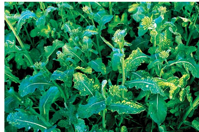
Rys. 1 Objawy niedoboru siarki w rzepaku